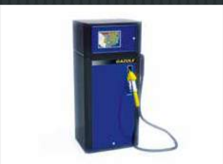
Distributeurs carburants, Adblue, gaz