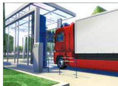
Portique de lavage