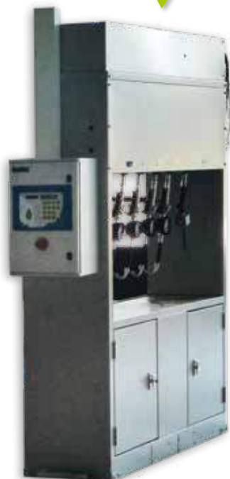
Lubrifiants, fluides industriels