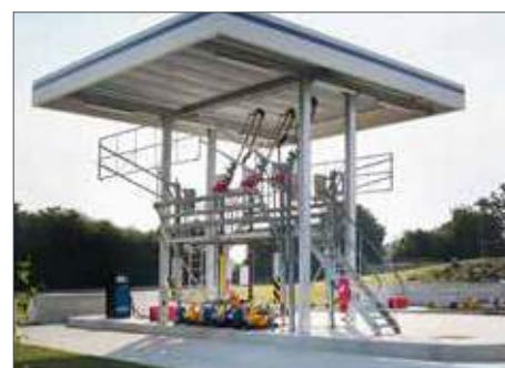
Poste de chargement