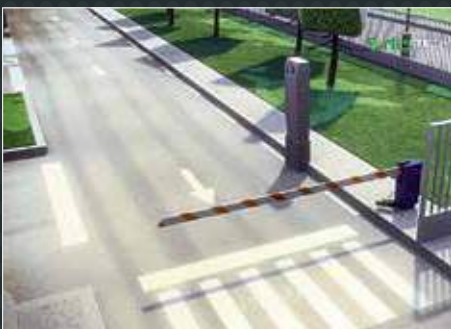
Contrôle d'accès portail

Evolutif, l'automate de gestion Epack asservit et centralise les périphériques de votre station-service (monté sur borne ou coffret).