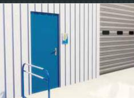
Contrôle d'accès porte