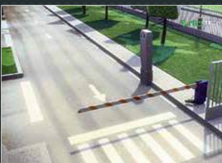
Contrôle d'accès portail

Evolutif, l'automate de gestion Epack asservit et centralise les périphériques de votre station-service (monté sur borne ou coffret).